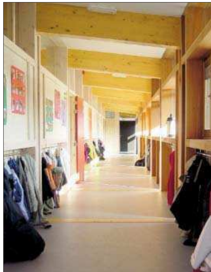
École communale de Walhain : la lumière se marie à cinq essences de bois différentes pour donner ce résultat chaleureux.