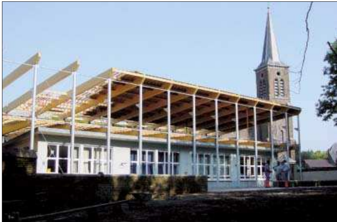
Pas question pour les deux architectes d'abattre à Walhain le bâtiment existant qui abritait quatre classes. La solution a donc été trouvée dans une construction en hauteur.

www.aabw.be Pour les sensibilisations dans les écoles, renseignements et inscriptions à la province : 010/ 236285.