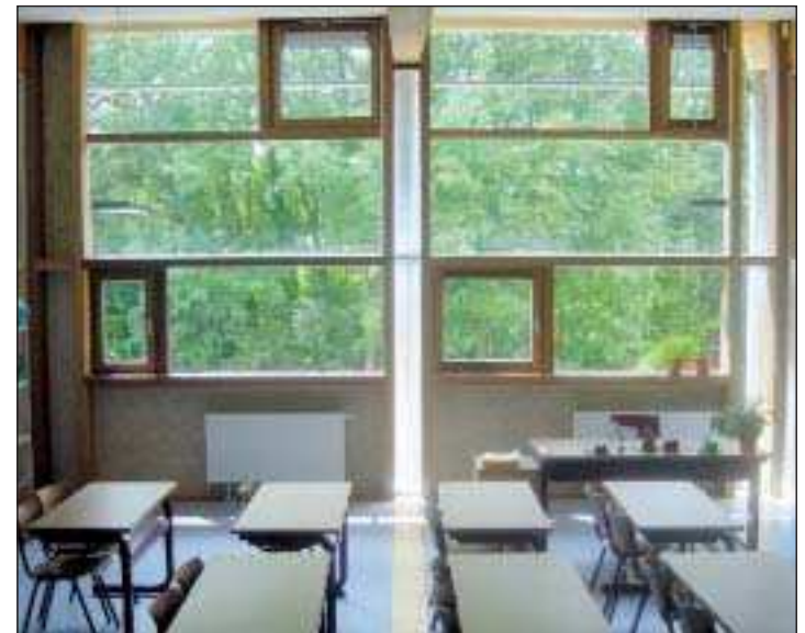
Avec de telles ouvertures, difficile de ne pas avoir envie de laisser ses idées vagabonder dans la verdure...