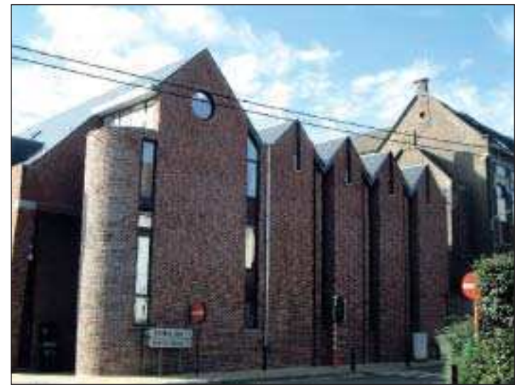
L'agrandissement de l'institut Saint-Jean-Baptiste, à Wavre, a remporté le second prix dans la catégorie « non-résidentiel ».

Tout renseignement complémentaire concernant le Prix de l'urbanisme et de l'architecture du BW peut être obtenu auprès du service provincial de l'aménagement du territoire (010/23 62 85).